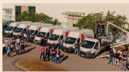
Mazza Sollevamenti. Il Team nel parco macchine

Al fianco di Mazza Sollevamenti, nasce Mazza Service srl che, con squadre di tecnici specializzati si occupa dell'installazione e del post-vendita effettuando